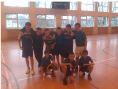
Inf. ZS Bieniów

Uczniowie klas IV - VI Zespołu Szkół w Bieniowie reprezentowali szkoły podstawowe Gminy Żary w trzech rozgrywkach na szczeblu powiatowym. W dniu 11 grudnia 2013 w Żarach zdobyli 3. miejsce w piłce koszykowej, 17 grudnia w Lubsku 2. miejsce w piłce siatkowej, 17 stycznia 2014 zdobyli kolejny puchar i medale za zajęcie 3. miejsca w rozgrywkach piłki ręcznej w Przewozie.